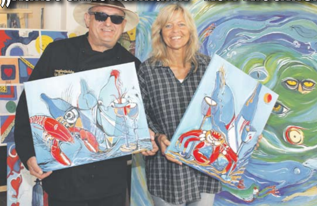
Die Völklinger Malerin hat sich einen Namen für Bilder mit gastronomischen Motiven gemacht. Ihre Bilder hängen auch in zahlreichen Restaurants. Im Jahr 2009 präsentierte sie auch ein vielbeachtetes Kinderkoch und Malbuch: Pelle, der Kartoffelbär. Ihre Ausstellung „Der Gastronom, der hinter die Kulissen schaut“ ist auch auf dem Markt zu sehen.

Am 21. und 22. November 2009 präsentiert Ihnen regioGuide den 1. Genussmarkt in Völklingen. Die Veranstaltung findet im historischen Wasserwerk Simschel statt. Der Genussmarkt ist samstags geöffnet von 10.00 Uhr bis 22.00 Uhr und sonntags von 10.00 Uhr bis 18.00 Uhr.